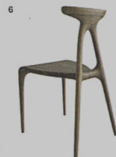
6 ALPHA - sedia Made in Ratio Brodie Neill ◉ madeinratio.com