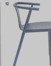
12 BAC blu Shanghai - sedia Cappellini Jasper Morrison ◉ cappellini.it