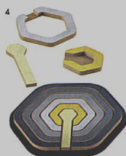
4 CONCENTRIC PUZZLE - gioco Danese Arik Levy ◉ danese milano.com