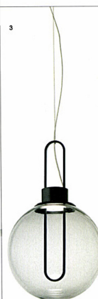
3 ORB - lampada a sospensione Modo Luce Büro Famos ◉ modoluce.com