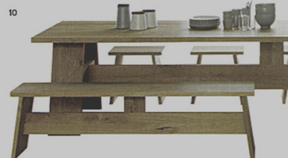
10 FAYLAND - tavolo FAWLEY - panca LANGLEY - sgabello e15 David Chipperfield ◉ e15.com