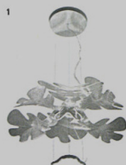
1 CHLOROPHYLLA - lampada a sospensione Artemide Ross Lovegrove ◉ artemide.com

Sedie, lampade, tavoli e divani. Ma anche un letto a baldacchino, un gioco didattico, un tapis roulant e un paio di scarpe realizzate con la stampante 3D. Ecco un assaggio di quello che vedremo durante la settimana milanese del design, dal 14 al 19 aprile. Tra nuovi progetti e finiture rinnovate, qui i mobili sono protagonisti