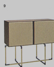
9 BAK - mobile contenitore Frag Ferruccio Laviani ◉ frag.it

Il divano del designer israeliano arriva alla sua versione definitiva. Rivestito di tessuto Blur - realizzato da Febrik in esclusiva per Moroso - nella gradazione rosso-viola, è disponibile nelle varianti a dondolo o stabile.