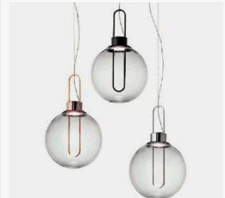
A GRAPPOLO Orb di Modo Luce, con fonte led e struttura metallica.