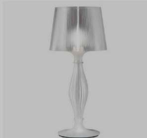
BAROCCA Liza di Slamp ha due fonti di luce, nella base e nel cappello.