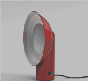
DA TAVOLO Ricorda le antiche lanterne a carburo Reverb di Zava, con dimmer.