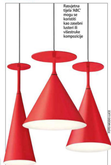
Rasvjetna tjela 'ABC' mogu se koristiti kao zasebni lusteri ili višestruke kompozicije