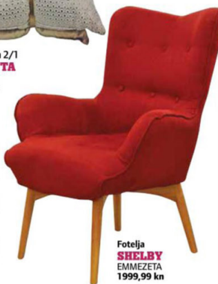
Fotelja SHELBY EMMEZETA 1999,99 kn

TALJANSKI BREND 'MODO LUCE' PREDSTAVIO SVOJE NOVE PROIZVODE