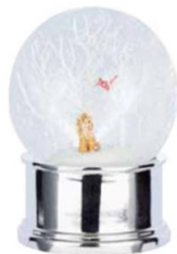
SNJEŽNA KUGLA "Dog Musical Snow Globe" - u njoj pas pjeva božićne pjesme, pa bi takav poklon mogao razveseliti samo prijatelje životinja.