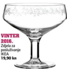
VINTER 2016. Zdjela za posluživanje IKEA 19,90 kn