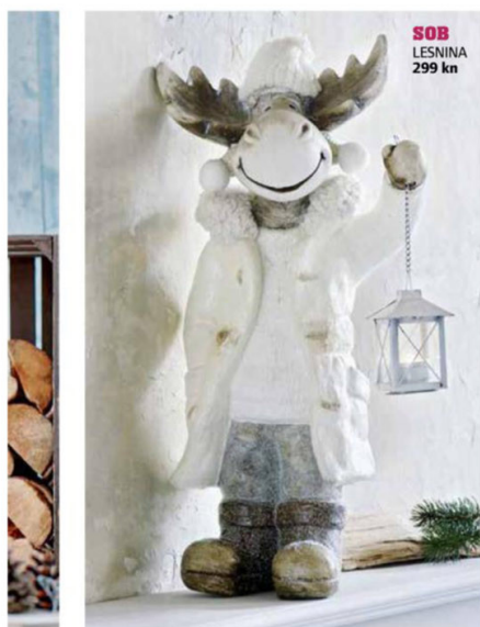
SOB LESNINA 299 kn