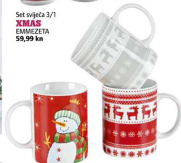
ŠALICA LESNINA 9 kn