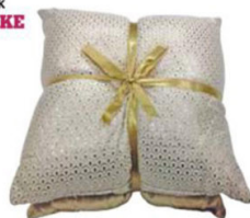
Set jastuka 2/1 CARLOTTA 30x30cm EMMEZETA 79,99 kn