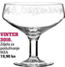
VINTER 2016. Zdjela za posluživanje IKEA 19,90 kn