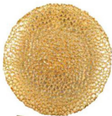
ZLATNI TANJUR 26 cm EMMEZETA 79,99 kn