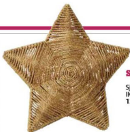
STRÁLA Sjenilo za visilicu IKEA 124,90 kn