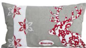
Ukrasni jastuk SNOWFLAKE 30x50cm EMMEZETA 79,99 kn