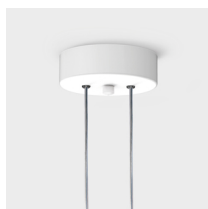
Dettaglio rosone L160 Bianco o Grafite