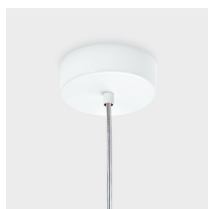
Dettaglio rosone L130 Bianco o Grafite