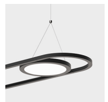
Raccordo sospensione 1 cavo acciaio