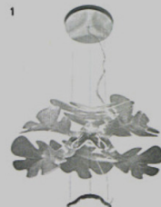
1 CHLOROPHYLLA - lampada a sospensione Artemide Ross Lovegrove ◉ artemide.com

Sedie, lampade, tavoli e divani. Ma anche un letto a baldacchino, un gioco didattico, un tapis roulant e un paio di scarpe realizzate con la stampante 3D. Ecco un assaggio di quello che vedremo durante la settimana milanese del design, dal 14 al 19 aprile. Tra nuovi progetti e finiture rinnovate, qui i mobili sono protagonisti