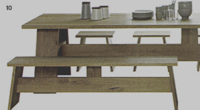
10 FAYLAND - tavolo FAWLEY - panca LANGLEY - sgabello e15 David Chipperfield ◉ e15.com