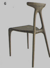
6 ALPHA - sedia Made in Ratio Brodie Neill ◉ madeinratio.com