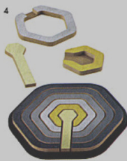
4 CONCENTRIC PUZZLE - gioco Danese Arik Levy ◉ danese milano.com