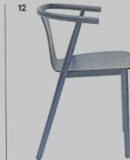
12 BAC blu Shanghai - sedia Cappellini Jasper Morrison ◉ cappellini.it