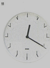
11 CLOCK IN CLOCK - orologio da parete Driade Nendo ◉ driade.com