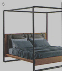
5 VOLARE - letto Poltrona Frau Roberto Lazzeroni ◉ poltronafrau.com