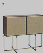
9 BAK - mobile contenitore Frag Ferruccio Laviani ◉ frag.it

Il divano del designer israeliano arriva alla sua versione definitiva. Rivestito di tessuto Blur - realizzato da Febrik in esclusiva per Moroso - nella gradazione rosso-viola, è disponibile nelle varianti a dondolo o stabile.