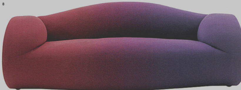
8 GLIDER - divano Moroso Ron Arad ◉ moroso.it

Il divano del designer israeliano arriva alla sua versione definitiva. Rivestito di tessuto Blur - realizzato da Febrik in esclusiva per Moroso - nella gradazione rosso-viola, è disponibile nelle varianti a dondolo o stabile.